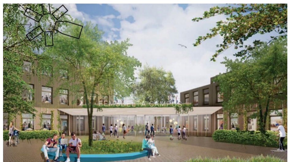
Impressie van de nieuw te bouwen Campus

Begin 2021 start de bouw van de Eemsdelta Campus , een schoolcampus op het terrein van voormalig verpleeghuis Solwerd dat onderwijs gaat geven aan ongeveer 1.700 leerlingen. Verder wordt er hard gewerkt aan een nieuw kindcentrum S(B)O De Delta/Bladergroen Appingedam (RENN4) , dat ook als tijdelijke onderkomen gaat fungeren voor kindcentrum OPwierde en kindcentrum Olingertil.