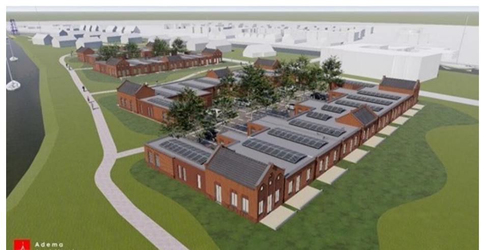
Impressie van de 30 huurhuizen die gerealiseerd gaan worden op 'De Tip'.